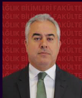
Assoc. Prof. Dr.