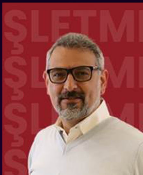
Asst. Prof. Dr.